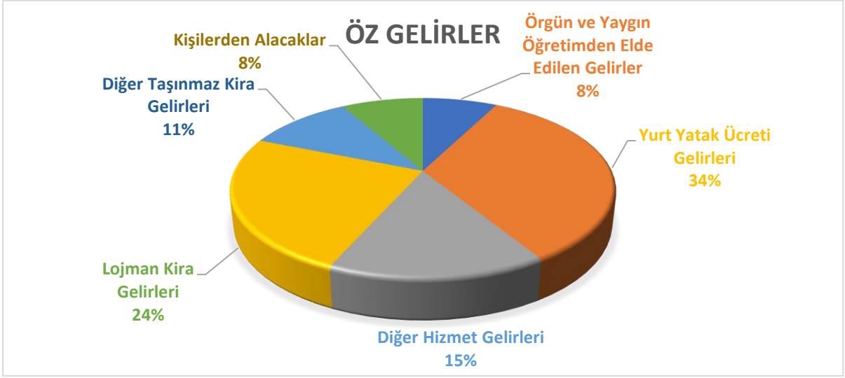
Grafik-5 Mart Ayı Öz Gelirlerinin Dağılımı (%)*